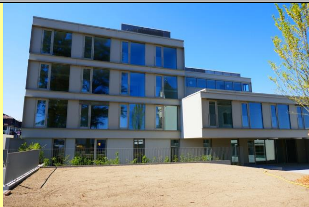
L'appartement se situe au 2 e étage.